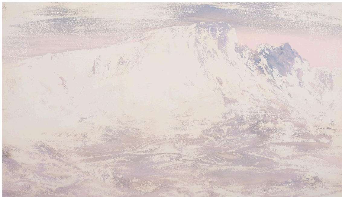
© Pedro Vaz , s/título, Acrílico sobre papel, 131 x 195 cm

Download da imagem em alta resolução aqui